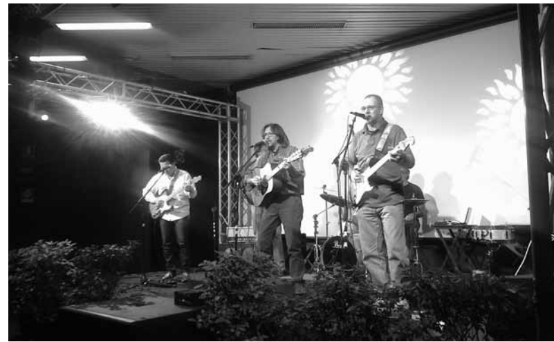
Il concerto degli Hocus Pocus al Centro Civico Buranello

Il Gruppo Mafalda da diversi anni opera a San Pier d'Arena con iniziative, discussioni, riflessioni su tematiche femminili e, recentemente, ha svolto attività di volontariato per quattro famiglie profughe ospiti nella delegazione, insegnando loro l'italiano e aiutandoli ad inserirsi nel nostro quartiere. Quest'anno abbiamo ritenuto opportuno lanciare una campagna di raccolta fondi a favore del Centro Antiviolenza della Provincia di Genova, una conquista delle donne che non vede garantiti per l'anno prossimo gli stanziamenti necessari alla sua sopravvivenza, alla quale hanno aderito numerose associazioni legate alla Rete Nazionale Antiviolenza.