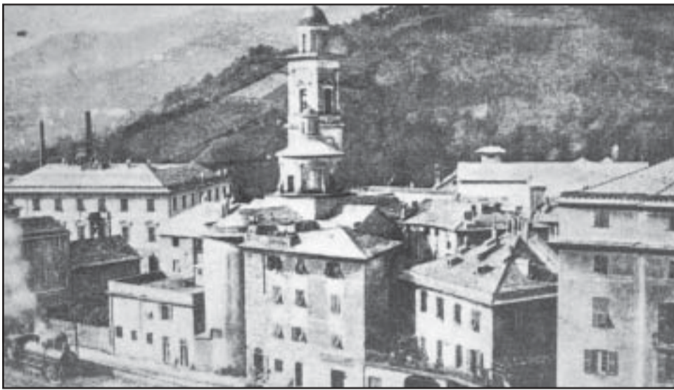
Pontedecimo nel 1903, con al centro la chiesa di San Giacomo